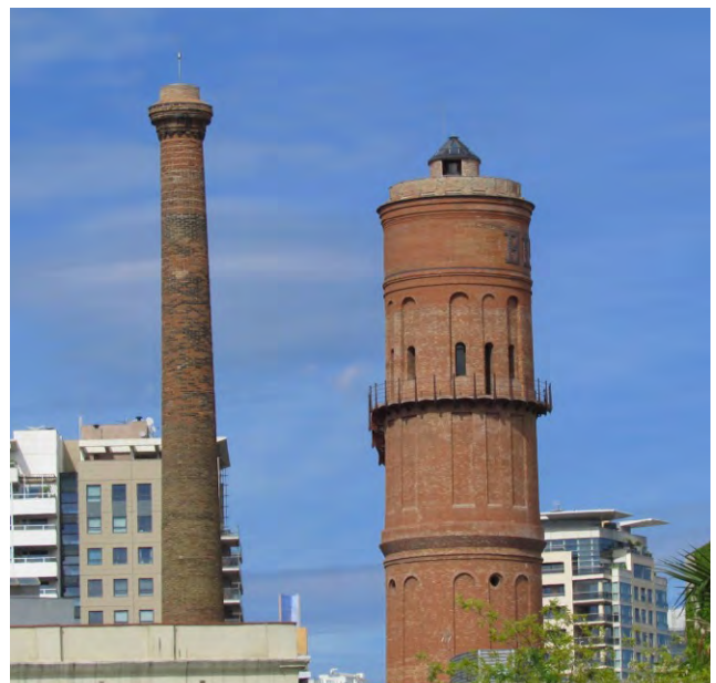
Antiga fàbrica Macosa a Sant Martí