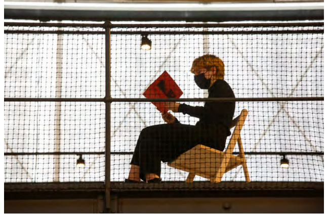
Interior rehabilitat a l'Oliva Artés.

S'hi van construir lavabos provisionals i es va preparar una exposició amb una mostra del que es veurà en el futur. Va ser una nova manera de donar-li vida a l'espai, malgrat no comptar encara amb les finestres ni la climatització. Celebrem que aviat s'inicia la fase següent, que seguirà sumant capes a la història d'aquesta nau tan singular.