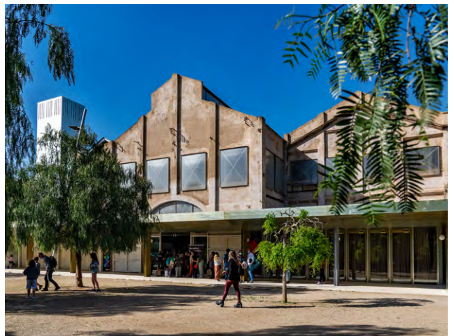
Vista Exterior Oliva Artés.

Aquest espai del MUHBA ha estat concebut com a espai laboratori del Museu d'Història de Barcelona al Poblenou. Vol ser un espai de trobada i participació sobre la història, el llegat i el patrimoni de la ciutat contemporània. Alhora, també és un espai que treballa amb associacions i centres d'estudis veïnals, com per exemple la Taula de l'Eix Pere IV, l'Arxiu Històric del Poble Nou, l'Associació de Veïns i Veïnes del Poblenou i el propi Col·legi d'Arquitectes.