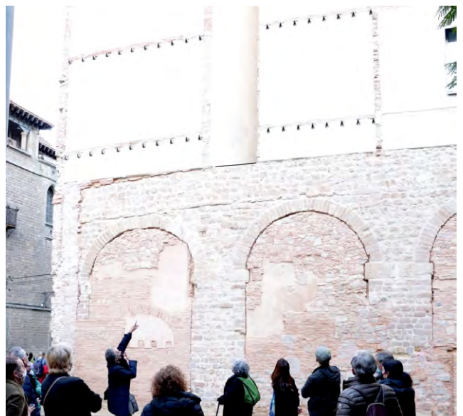
Traces de l'Aqüeducte Romà de Barcelona. Visita Cicle de l'Aigua a la Trobada de Proximitat dels arquitectes de Ciutat Vella.

L'Arquitectura de l'aigua és un patrimoni molt fràgil però a la vegada transcendent per poder comprendre el creixement de població de la nostra ciutat. Us convidem a gaudir del cicle de visites que els grups d'arquitectes de proximitat del COAC han realitzat i així poder conèixer, valorar i respectar un patrimoni ben desconegut.