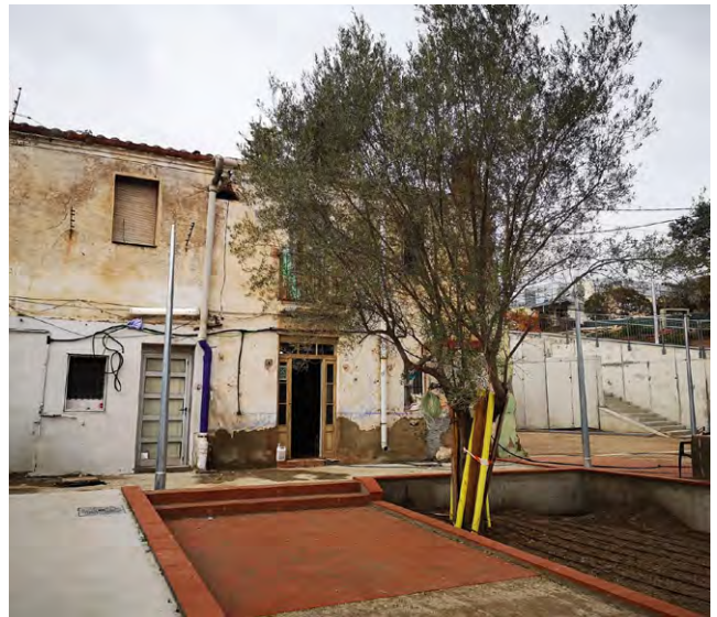
Una de les cases conservades. Joaquim Borràs.

Es contemplen zones que amb la qualificació 18c subjectes a possibles desenvolupaments urbans futurs com és el cas de la zona situada al costat de la Baixada de Can Mateu on s'està construint un conjunt d'habitatges. En la zona verda del costat s'ha treballat per transmetre els valors d'aquest patrimoni fràgil de l'aigua de les bugaderes i s'han conservat dos dels quatre habitatges com a zona destinada a equipaments. Es treballa en la possibilitat d'albergar un centre d'interpretació didàctic que divulgui la història i promogui l'interès per recuperar la memòria d'aquest lloc, alhora que estigui obert al veïnat, a les escoles i a qualsevol altra centre de formació.