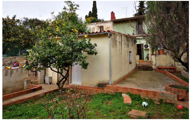
Casa tradicional d'una bugadera situada a l'illa de les Bugaderes a Horta. Joaquim Borràs

Per a l'assecat de la roba i els elements de vegetació arbres, se situen en la part sud de la parcel·la i se separen de l'habitatge i hort, situats a dalt, mitjançant un carreró, de manera que l'activitat del rentat no interfereix amb la resta de la vida familiar.