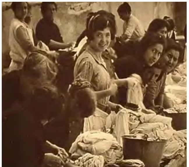
Bugaderes d'Horta.

El dilluns era el dia de la recollida en el Pla i el dissabte era el dia en què se la tornava, blanca i immaculada. Els dijous i els divendres, Horta era un gran llençol blanc, tendit al sol. L'expressió popular que utilitzem a Barcelona de 'Fer dissabte' ve d'aquí. És el dia que s'ordenava la roba neta recentment portada i s'acompanyava amb la neteja íntegra de la casa. En acabar, s'emportaven la roba bruta.