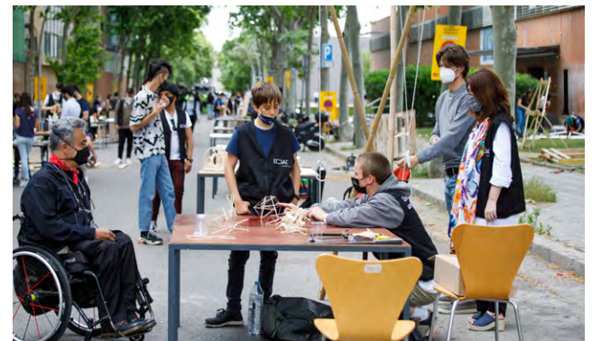
Festa de l'arquitectura 2021.

futur de pacificar i renaturalitzar aquesta via com un eix vertebrador de connexió del Campus sud amb la resta del districte i la ciutat.