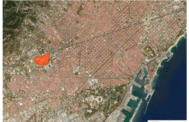
Impuls Pla Campus Sud. Imatge virtual des de l'àgora central de Bederrida. Ajuntament de Barcelona

Recomanem la lectura de l'article “Cases, barris i... ciutats que curen?” de mayorga+fontana arquitectos.