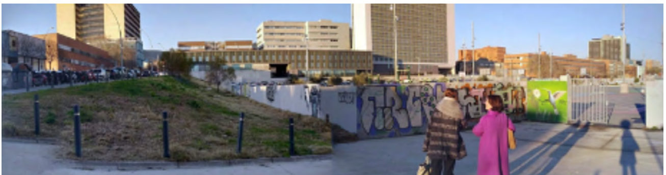
Arquitectes de Les Corts

En general es tractaria de dissenyar un entorn on la ciutadania-vianants siguin els protagonistes de l'espai públic, ocupant uns espais amables, lliures de barreres arquitectòniques i on el cotxe perdi el protagonisme que té avui. Alhora, buscar sinergies entre aquesta proposta i altres actuacions en l'àmbit urbà més proper que estan treballant en la mateixa direcció, com ara el nou Espai Barça. També millorar la permeabilitat amb altres espais fronterers amb la Zona Universitària i amb vocació d'espai públic, com els Jardins de la Maternitat al campus sud o el Parc de Cervantes al campus nord. Evidentment, les universitats han de participar en aquest espai públic obrint les portes de l'art, la ciència i la tecnologia a la ciutadania.