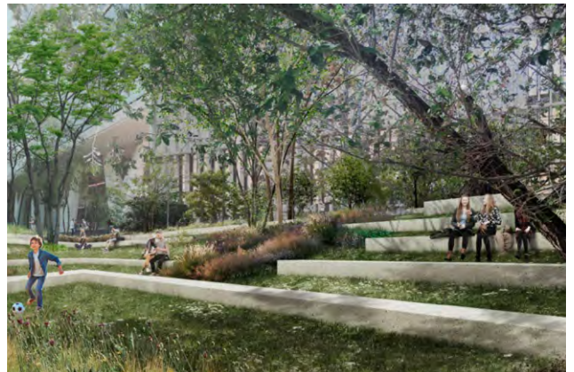
Impuls Pla Campus Sud. Imatge virtual des de l'àgora central de Bederrida. Ajuntament de Barcelona

Per tant, el Campus universitari hauria de ser un espai on es pugui estudiar, viure i treballar a la vegada. Hauria de ser una zona dotada de tots els serveis i comerços per a l'estudiant i el professorat, així com zones de lleure i oci per tal de seguir donant vida al Campus més enllà del cicle acadèmic. En aquest sentit la integració de l'espai públic en el dia a dia de la ciutat és essencial en la vertebració del Campus universitari. Per això, cal fer de l'espai lliure un element que posi en valor l'essència de la ciutat contemporània com a lloc d'activitat i aprenentatge fora de l'aula,