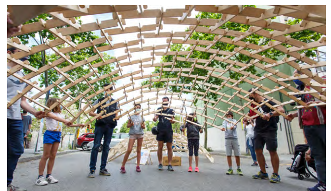
Festa arquitectura 2021.

Per això, els estudiants de l'assignatura de Tecnologies de Baix Cost de l'ETSAB aportaran un conjunt de tallers de maquetes a escala 1/20 i escala real, per experimentar la construcció amb materials reciclats com cartró, fusta de palets, canyes o bambú. Aquestes construccions poden ajudar a la transformació dels patis dels centres educatius, generant ombres i espais de joc.