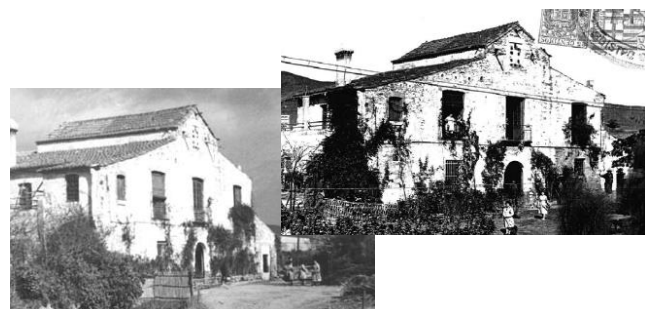
Ajuntament de Barcelona

Identificació i reconeixement de les vies històriques de l'Àrea Metropolitana de Barcelona