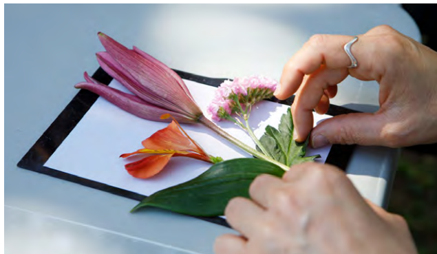
Festa d'Arquitectura Nou Barris 2021 – Taller de fotografia amb flors.

Aquests colors i bones olors també són el record de tothom i en especial de les moltes núvies del barri que venien a Can Valent a buscar el seu ram de casament. Aquests testimonis ens ajuden a imaginar com devia ser aquest entorn amb tan de color i bones olors.