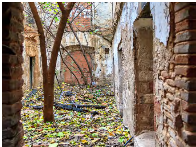
Vista del pati de Can Valent. Carles Serrano ALEAOLEA | ARCHITECTURE & LANDSCAPE