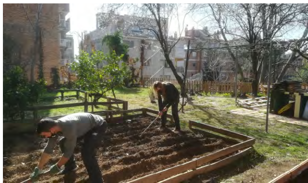
El projecte també pretén trencar l'estigma del col·lectiu. Projecte Fènix aspb.cat