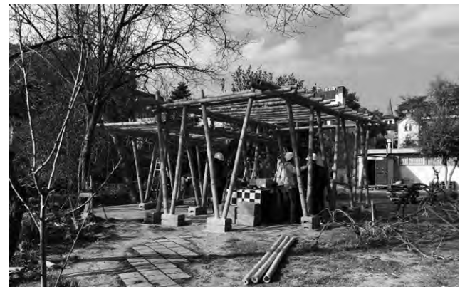
Pèrgola de Bambú als Jardins Fènix. Arquitectes de Sarrià Sant-Gervasi.

lliure. La seva ubicació, al costat dels Jardins del Dr. Roig i Raventós, estimula la integració amb la resta del barri.