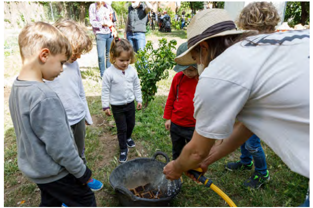
El projecte també pretén trencar l'estigma del col·lectiu.