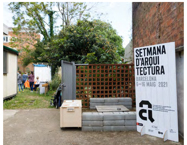
Festa d'Arquitectura Sarrià-Sant Gervasi 2021.

A l'abril els estudiants de la UIC van començar a familiaritzar-se amb la construcció d'un pilar de bambú per actuacions efímeres per tal d'aprendre a treballar amb aquest material sostenible i poder incorporar-ho en els seus dissenys.